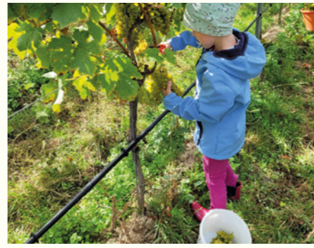
Früh übt sich: Kinder sind die besten Qualitätsmanager – Saure Trauben werden nämlich einfach ausgespuckt.